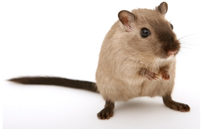
Myš | Maus