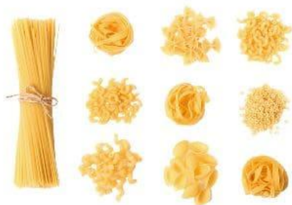
|| těstoviny ?